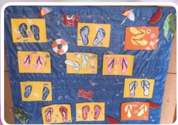
児童発達支援「サンダル」