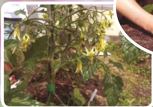
児童発達支援 ミニトマト農園