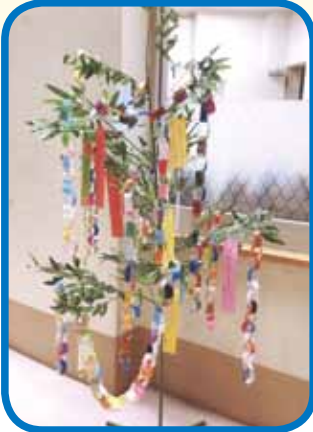
ご利用者様の作品