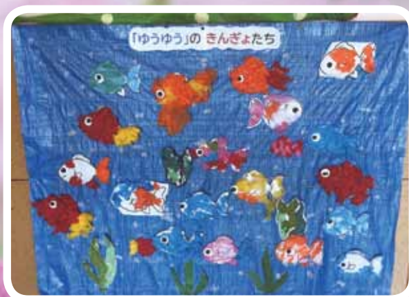
放課後等デイサービス「金魚」