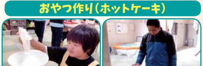
おやつ作り(ホットケーキ)