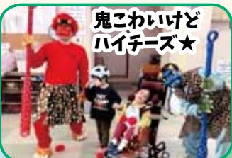
鬼こわいけどハイチーズ★