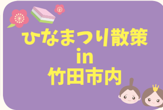
ひなまつり散策 in 竹田市内