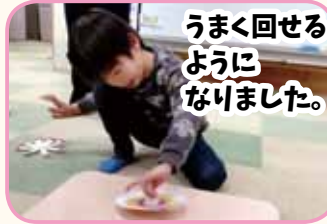
うまく回せるようになりました。