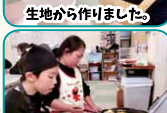
生地から作りました。