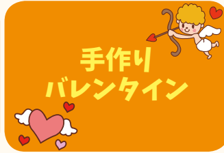
手作りバレンタイン