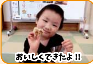
おいしくできたよ!!