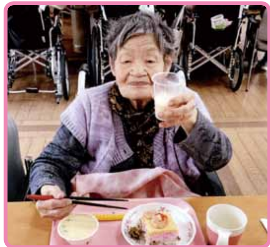
行事食と甘酒を頂きました