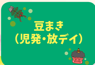
豆まき (児発・放デイ)