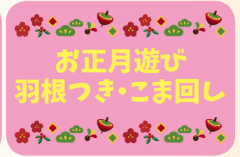
お正月遊び 羽根つき・こま回し