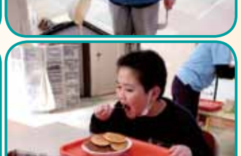
できたてはおいしい♡