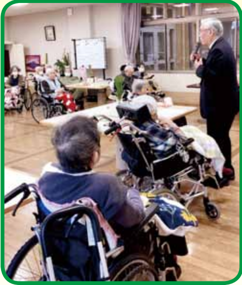
理事長の新年の挨拶