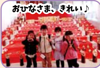
おひなさま、きれい!