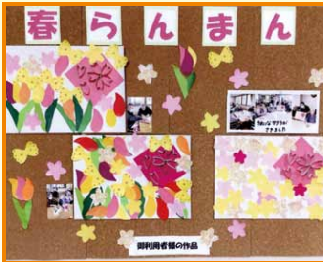
きれいな花がたくさん咲きました