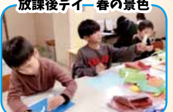
放課後デイ 春の景色